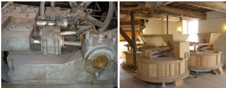
Impermo Museum Plunjerpomp

Emaillerie Saint-Trond) en nog steeds werkzame metaalbedrijven (FLAM). In deze buurt werd ook een exclusief geleid bezoek gebracht aan het bedrijfsmuseum van de tegel- en steenfabriek IMPERMO, waarin zowel het vroegere productieproces als de actuele bedrijfsactiviteiten van dit bloeiend familiaal bedrijf werd belicht, tot en met een bezoek aan de bouwwerf van nieuwe magazijnen.