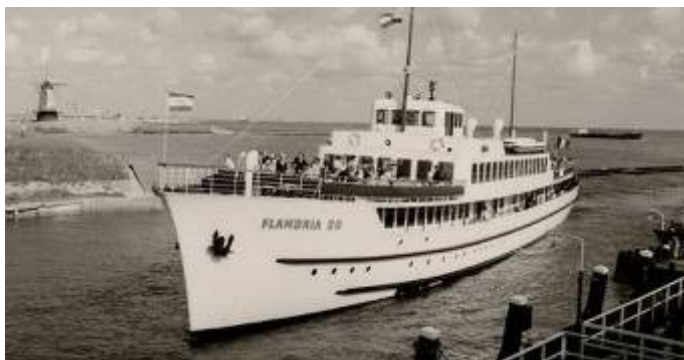
De Flandria 20

De zogenaamde "Museumdokken" (het Bonaparte- en Willemdok) zijn weer een schip armer. De Flandria 20, voor velen de mooiste van de Flandrias (zie Ruimschoots, jg. 10, nr. 3, p. 5-7), werd verkocht aan een Nederlandse eigenaar en vertrok onlangs uit Antwerpen. Ook de enige oude "emmerbaggerboot" (1929) van het Antwerps Havenbedrijf wordt (na een mislukte poging van verkoop) mogelijks verschroot. Intussen pronkt de stoomgraan-elevator Antwerpen 19 (overschilderd met "Rotterdam 19" !) in Rotterdam. En het vlaggenschip van de Antwerpse sleepbootrederij URS ? Ook verkocht aan Nederland. En de statiesloep Napoleon Bonaparte? Dat is nu het pronkstuk van het Musée de la Marine te... Parijs !