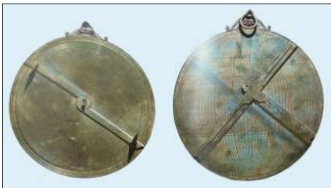
Astrolabia afkomstig uit Koninklijke Sterrenwacht Ukkel

1828. De collectie werd ook aangevuld met zeldzame instrumenten uit de Koninklijke Sterrenwacht van België en het Koninklijk Meteorologisch Instituut van België. Toegang: di tot zo 10 tot 17 uur. Zie ook www.kmkg.be .