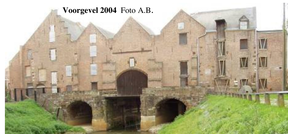
Voorgevel 2004

Over weinig monumenten in Vlaanderen werden zoveel thesissen en bijdragen geschreven. In 2004 realiseerde SIWE vzw in een zaal nabij de molens een druk bezochte, sensibiliserende tentoonstelling over de 's Hertogenmolens (zie SIWE-Magazine 18-19). WAGDI (Werkgroep Aarschotse Geschiedkundige Documentatie en Informatie) realiseerde vervolgens het boek "Vijfhonderd jaar Grote Molens op de Demer te Aarschot" (intussen onlangs heruitgegeven). Dit alles kwam de restauratie door de architectuurbureaus noA en Robbrecht & Daem ten goede.