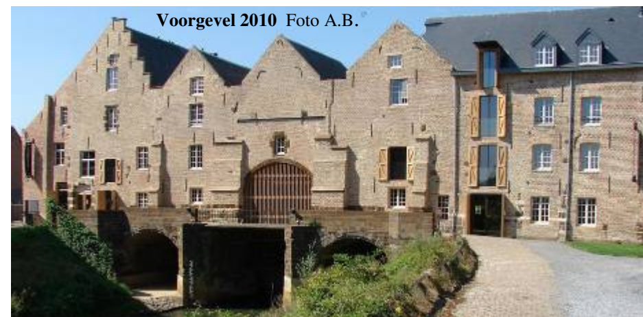
Voorgevel 2010

Op 12 juni vond de officiële opening plaats van de gerestaureerde molens. SIWE ging een kijkje nemen in het tot brasserie, feestzaaltje en hotel gerestaureerd complex. De typische verhoudingen en vroegere structuur (o.m. de unieke opeenvolging van onregelmatige dakvormen) werden gerespecteerd maar ingestorte (of verdwenen) delen hebben een hedendaagse look en materiaaluitvoering gekregen (onder meer een gevel in Corten-staal op een betonnen onderbouw). De oude elementen van de sluis werden behouden. Het monument heeft een transformatie doorstaan van "schandvlek" tot scharnierplek tussen het noordelijk en zuidelijk deel van Aarschot.