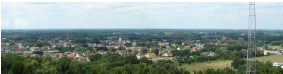
Uitzicht van op de watertoren