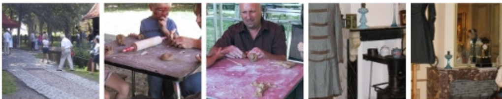
uit website http://www.kortrijk.be/fotoalbum/festivaldag

Combineer je bezoek aan het museum met een kennismaking met relicten van de vlasnijverheid, bezoek authentieke vlassites met werkende machines: contacteer hiervoor het Streekbezoekerscentrum op telefoon 056/27.78.40. Ook kan u deze bezoeken combineren met een bedrijfsbezoek in het Texas van Vlaanderen. Informeer en reserveer hiervoor bij Toerisme Kortrijk, Begijnhofpark, 8500 Kortrijk (ook op telefoon 056/27.78.40), www.toerismekortrijk.be