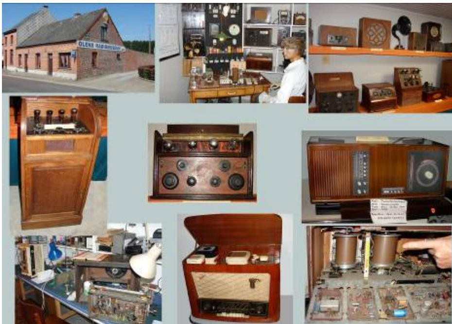
Enkele beelden van de rijke verzameling Foto A.B.

Het engelengeduld en de enorme deskundigheid, nodig om deze radio's (uit alle perioden) te onderhouden en de collectie -waar mogelijk- nog aan te vullen, bleek nog meer bij het bezoek achter de schermen in de depots en de werkplaatsen van het museum. Te bedenken dat hier alleen vrijwilligers (met een enorme bescheidenheid) werken zonder structurele ondersteuning en met een dergelijk uniek museum als resultaat... Het deed bij meer dan één deelnemer van de SIWE-groep vragen rijzen over de verdeling van de overheidsmiddelen. Dit museum is nu representatief voor de groep van Vlaamse musea die staan of vallen met het echte vrijwilligerswerk.