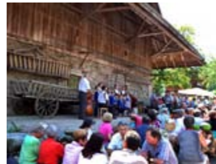
Am «Schweizerischen Mühlttag» wird auch musiziert und gejodelt.