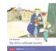
Ulf Nilsson: Als Oma seltsam wurde

Berühmte Maler und ihre Meisterwerke entdecken. (Jugend Mittelstufe)