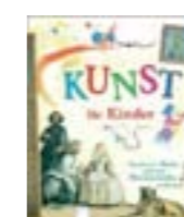
KUNST für Kinder

Ein spannender Abenteuer- und Fantasyroman um das Geschwisterpaar Mona und Patrick, die auf dem Gut ihrer Grossmutter in Irland Ferien machen. Doch schaurige Gestalten treiben hier ihr Unwesen ... (Jugend Mittelstufe)