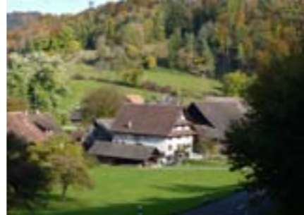
Der Weiler Aumüli, schützenswertes Objekt von kantonaler Bedeutung.