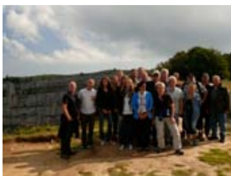
Gemeindepersonal vor dem «Creux du Van»

Das Personal der Gemeinde- und Schulverwaltung, des Gemeindebauamtes und des Werkhofes waren auf der diesjährige Personalreise Ende August im Neuenburger Jura (Val de