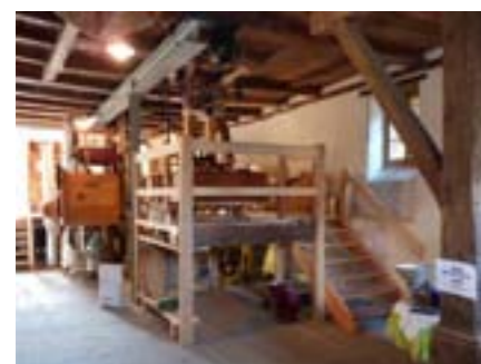
Die Mühleinrichtung im Mahlraum, wo nach 100 Jahren wieder Getreide gemahlen wird.

Ab 1998 wurde die Aumüli Schritt für Schritt und unter kundiger Aufsicht der Denkmalpflege restauriert. Zuerst das Wasserrad, dann die Sägerei, dann mussten Fundamente und Mauern des Mühlegebäudes trockengelegt werden, der Garten wurde nach historischen Vorlagen neu angelegt, eine alte Mühleinrichtung konnte im Mühleraum eingebaut werden, das Wehr in der Reppisch musste ersetzt und Ober- und Unterwasserkanal saniert werden, und