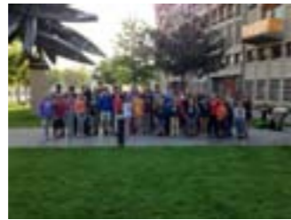
Alle Schweizer, die beim Final dabei waren

fuhren meine Mutter und ich mit der Métro zu unserem Hotel, auf einigen Irrwegen. Aber schliesslich haben wir es doch gefunden. Am nächsten Morgen mussten wir früh aufstehen, weil wir uns um 8.35 Uhr schon mit allen Schweizern zum Foto-Shooting treffen wollten.