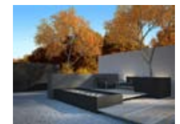
NEU IN DER SCHWEIZ! PLATOFLEX®

Für die Verwirklichung Ihrer neuen Gartenanlage, einer Teilveränderung des Gartens, einer Gestaltung der Terrasse, des Balkons oder eines Firmengeländes, bin ich gerne Ihre Partnerin.