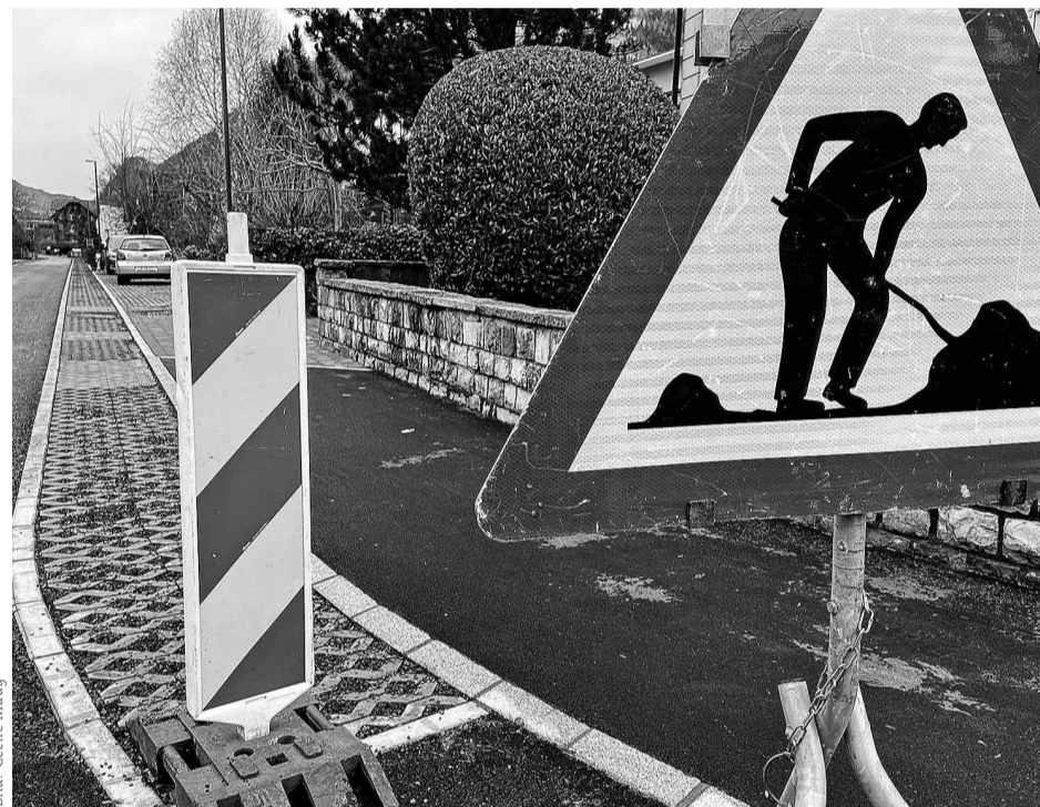
Dieser neue Sickerstreifen zielt den Strassenrand an der Brisenstrasse.

«Da hier zudem Tempo 30 gilt, ist in diesem Bereich Mischverkehr möglich. Das heisst, spielende Kinder, Fussgänger, Velofahrer sowie Autos teilen sich den