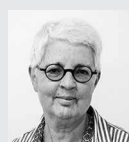
Agatha Flury Lektorat und Korrektorat

Der Nachdruck sämtlicher Artikel und Illustrationen ist unter Angabe der Quelle ausdrücklich erlaubt. Für den Verlust nicht verlangter Artikel kann die Redaktion keine Verantwortung übernehmen.