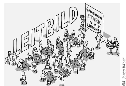
Leitbildkonferenz, 21. März, 17 bis 21 Uhr.

Moderiert wird der Anlass von der Agentur «frischer wind» aus Zürich, einer Firma mit viel Erfahrung in der Durchführung von Grossgruppenanlässen. Wer eine Einladung erhalten, sich aber noch nicht angemeldet hat, kann dies unter info@schule-stans.ch bis am 3. März nachholen. Die Teilnehmerzahl ist auf 250 Personen beschränkt.