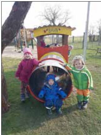
Die Kinder und Erzieher vom "Käferparadies" Dautzchen