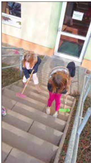
Die Erzieher der Kinderoase Beilrode

Genau das war unser Motto in der Kinderoase zu einem Frühjahrsputz in der Woche vom 8. - 12. März 2021. Ein großer Container wurde auf unserem Hof abgestellt. Die Vorschulkinder und die Hortkinder der Klassen 1 - 3 halfen sehr, sehr fleißig mit, das Laub vom vergangenen Herbst zusammen zu harken und mit Schubkarren und Körben in den Container zu transportieren. Unseren Weidenzaun stellten die Kinder der Klasse 4 fertig und wir bedanken uns beim Landschaftspflegeverband für die gute Zusammenarbeit. Außerdem waren bei unserem Einsatz die kleinen Mülldektive unterwegs und sammelten so manches für die Mülltonne ein. Vielen Dank auch unseren Hausmeistern für die tatkräftige Unterstützung.