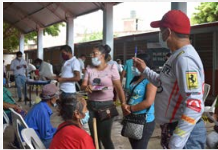
CASA DEL AGRICULTOR

Y en apoyo a este sector, se gestionó ante el gobierno del estado, vacuna contra el derrengue, por la importancia de prevenir esta enfermedad que afecta la ganadería, la vacuna se entregó con ayuda de las 3 asociaciones ganaderas para que se realizara la entrega pertinente a cada ganadero del municipio, entregando 1,600 dosis beneficiando a ganaderos de distintas localidades como son Tiripitio, Pozo Azul, El Huaca, El Ranchito, La Mesa de Tecu, Los Cuitases, El Tepahuaje, El Salitre, Las Juntas del Tanque, El Timbinal, El Borbollon, La Laja, Las Pilas, La Quiringuca, Soledad Chiquita, El Guayabal y Mesa del Aire.