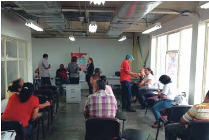
Imagen 4: Taller Diagnóstico Económico Productivo Participativo en el Municipio García de Hevia

Taller Diagnóstico Económico Productivo Participativo en el Municipio García de Hevia. Marzo de 2013.