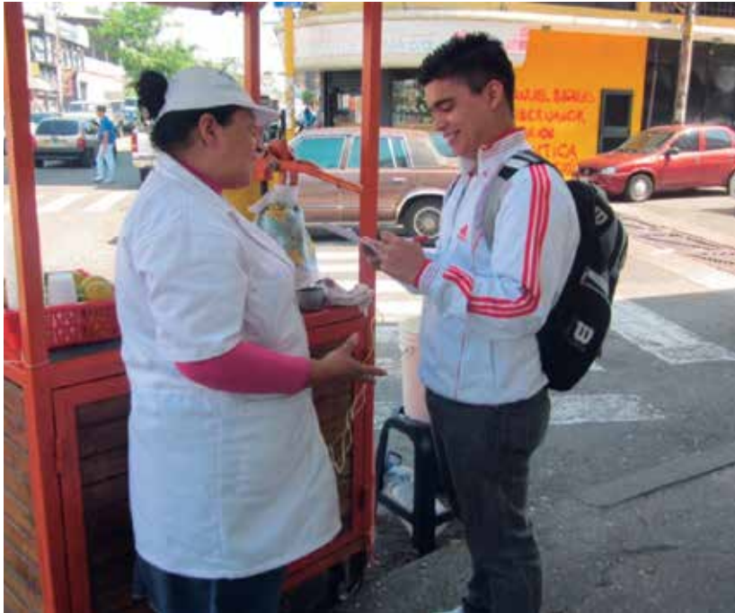
Imagen 6: Encuesta a ocupado informal (OSET-UCAT)

Encuesta a un ocupado informal. Febrero de 2013.