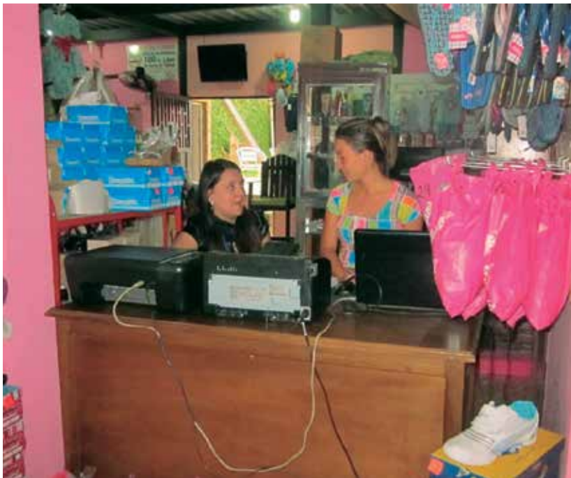
Imagen 5: Encuesta a ocupado formal (OSET-UCAT)

Encuesta a un ocupado formal. Febrero de 2013.