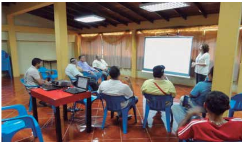
Imagen 2: Taller Diagnóstico Económico Productivo Participativo en el Municipio Seboruco

Taller Diagnóstico Económico Productivo Participativo en el Municipio Seboruco. Febrero de 2013.