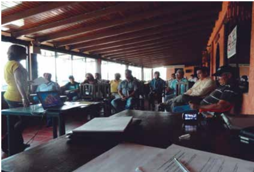
Imagen 3: Taller Diagnóstico Económico Productivo Participativo en el Municipio Libertador

Taller Diagnóstico Económico Productivo Participativo en el Municipio Libertador. Marzo de 2013.