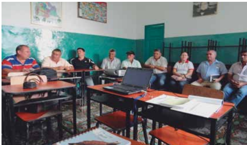
Imagen 1: Taller Diagnóstico Económico Productivo Participativo en el Municipio Jáuregui

Fuente: archivo fotográfico del OSET-UCAT. Taller Diagnóstico Económico Productivo Participativo en el Municipio Jáuregui. Marzo de 2013.