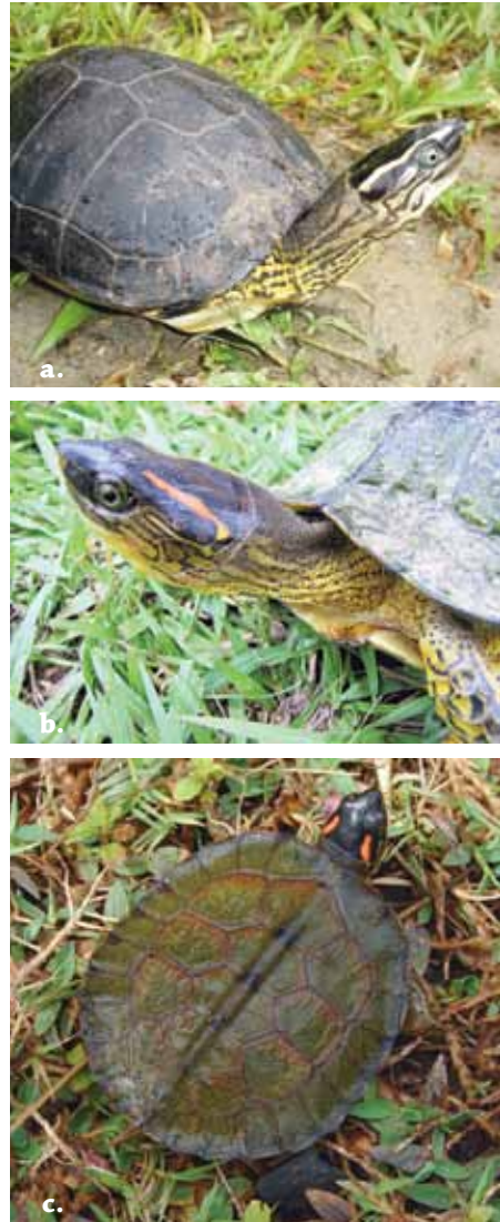
Figura 9. Rhinoclemmys melanosterna , variantes de color de la banda supratemporal. a) Amarilla en hembra de Isla Palma; b) naranja en hembra y c) neonato del Magdalena medio.

Hay datos del tamaño de un macho en el Magdalena medio antioqueño que fue re-