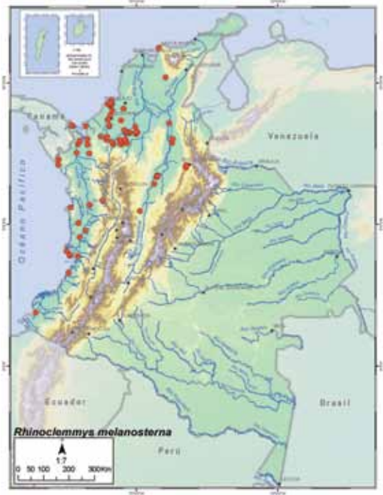
Registros de Rhinoclemmys melanosterna

Hábitat. En Colombia, el área de distribución incluye bosque pluvial, bosque húmedo tropical y zonas de bosque seco tropical en el norte del país. Habitan la zona de la planicie costera Pacífica en elevaciones menores de 175 m s.n.m. (Carr y Almendáriz 1990, Corredor-L. et al. 2007). La especie puede encontrarse en agua dulce y salobre, incluyendo ríos, quebradas y arroyos, estanques, pozas, terrenos pantanosos y lagunas cercana a playas marinas (Medem 1962, Castaño-M. et al. 2005, Corredor-L. et al. 2007). También, ha sido encontrada lejos de las orillas de cuerpos de agua, especialmente en zonas bajas y húmedas dominadas por una especie de Heliconia , las cuales son conocidas como “bijaoguales” (Medem 1962). Los individuos pueden refugiarse entre raíces y hojarasca (Castaño-M. et al. 2005) e ingresar a zonas de manglar con agua salada o salobre (Medem 1962), también se les ha encontrado en zonas cercanas a drenaje