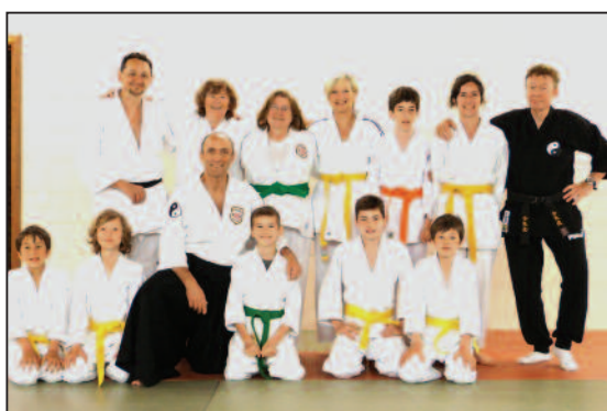
Examens (collège de Godinne le 10/5/2016)