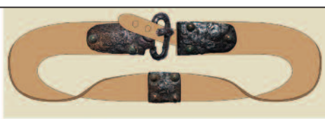
Ensemble de ceinture damasquiné

Les rites funéraires des tombes mérovingiennes (début d'occupation du cimetière de Spontin vers 520/530) sont proches de ceux des tombes du Bas-Empire. Hommes et femmes étaient souvent munis d'une ceinture de cuir fermée par une boucle métallique, une petite sacoche y était souvent associée. La quantité et la qualité d'armes (épées damassées, scramasaxes, haches) dans les sépultures reflètent le niveau social du défunt. Les perles ont connu un succès énorme à l'époque mérovingienne : les formes, couleurs et décors n'ont jamais été aussi variés ; les colliers exposés en témoignent.