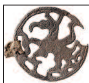
Rouelle au Griffon

160 tombes ont été fouillées voici 150 ans par la Société archéologique de Namur. Le quartier du Bouchat n'en laisse plus rien paraître. Au Bas-Empire (cimetière de Spontin : 380 apr. J.-C.), les défunts ont été inhumés habillés et munis de leurs armes et de leurs bijoux. Offrandes, pièces de monnaie, récipients en céramique, verre et métal, ustensiles, coffrets... sont déposés auprès des défunts.