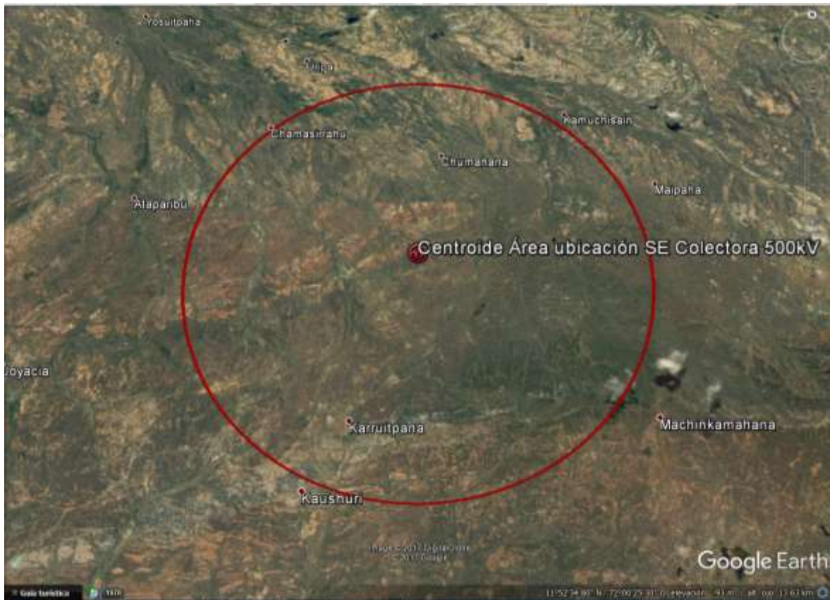
Figura 6 – Ubicación Subestación Colectora 500 kV